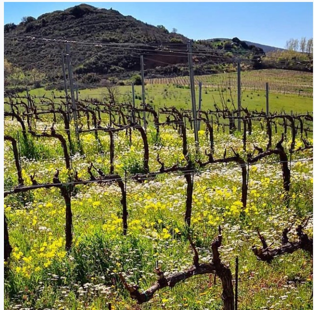
Vigneto di Nuragus