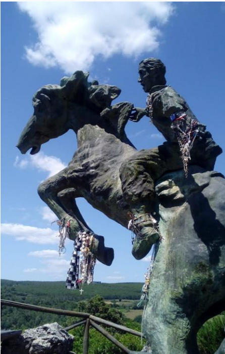
Sant'Ignazio da Laconi