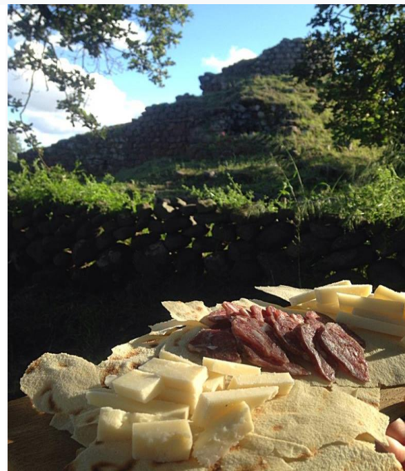
Nuraghe Lugherras con piccolo Picnic