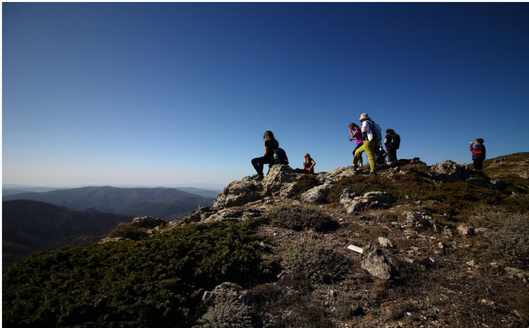
Gennargentu verso Punta la Marmora