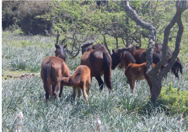
Cavallini della Giara