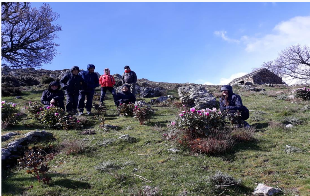
Peonie in fiore sul Gennargentu