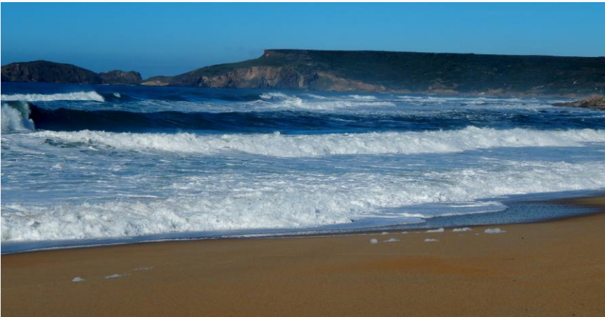
Spiaggia di Pistis (Capo Frasca)